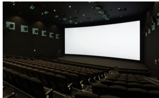
【TCX®導入劇場イメージ】

「TCX®」の圧倒的な巨大スクリーンは、通常スクリーンのワンランク上を行く臨場感あふれる映像をご提供いたします。家庭でも大きなモニターで映画を鑑賞できるようになりましたが、「TCX®」の大迫力映像を体験すれば、映画館で観ることの意味をあらためて感じるようになります。